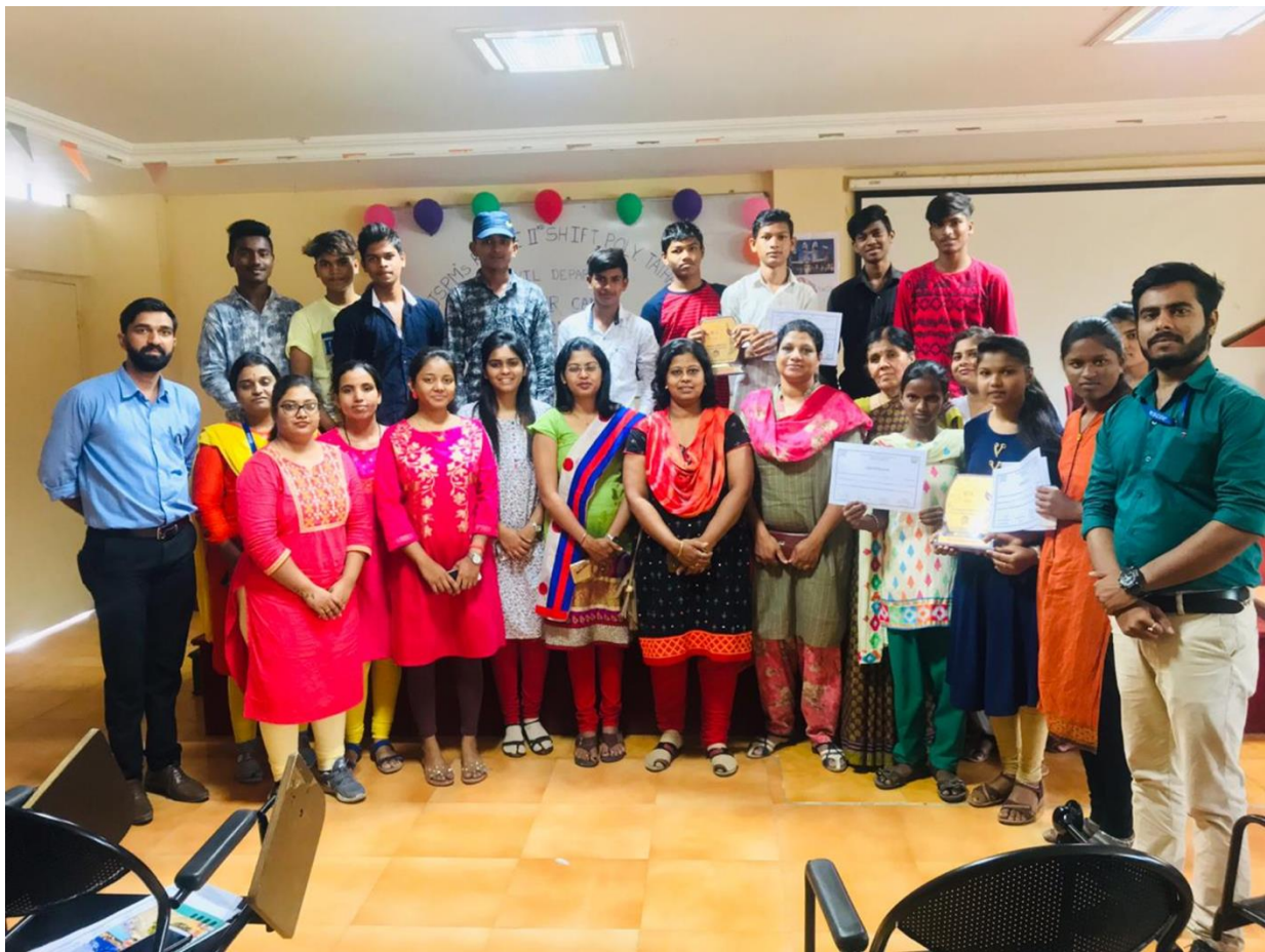
9th July.2019-National Book Lover's Day