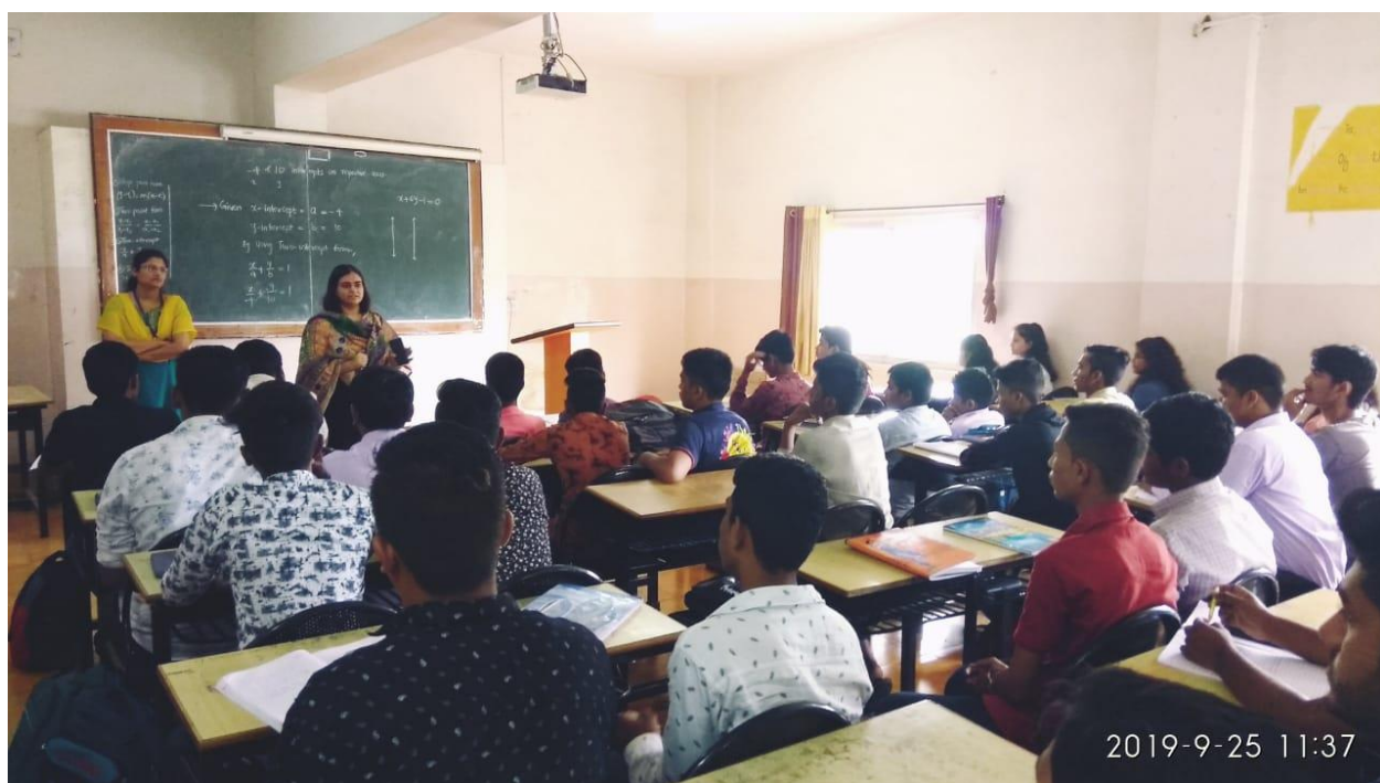
25th Sept.2019-counseling program