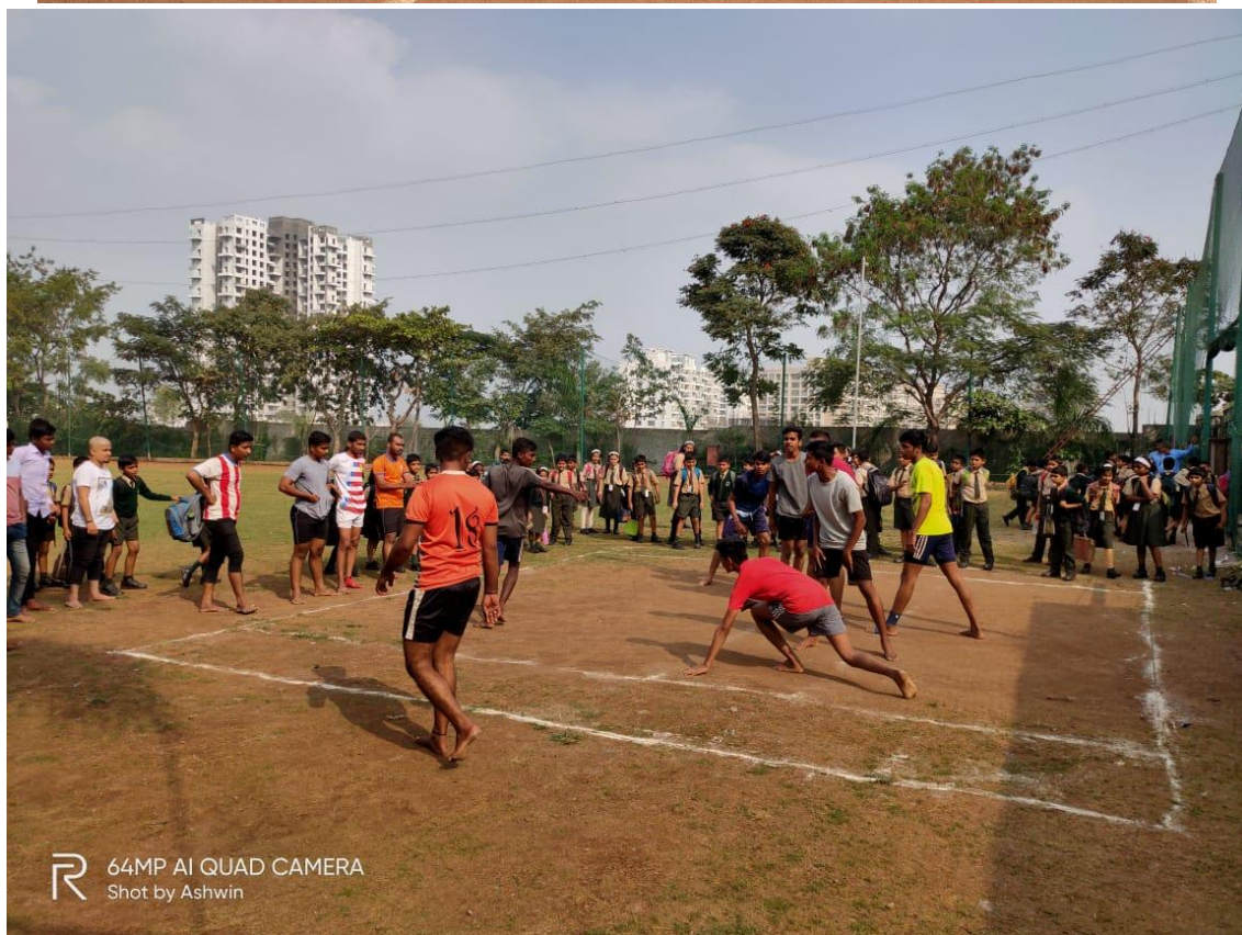
Sport Activity 23 December 2019