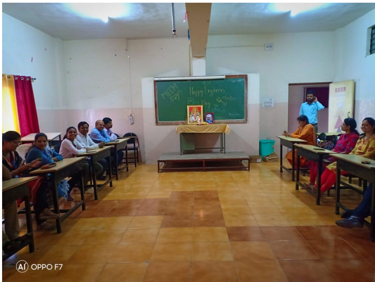
15 th Sept.2019-Engineer's Day