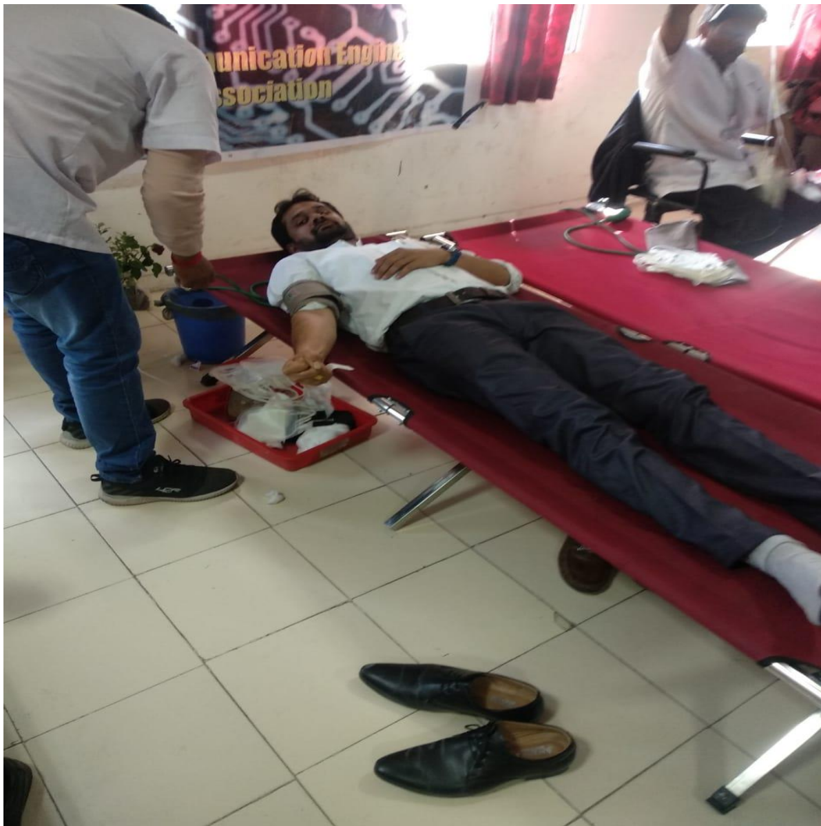
Blood Donation Camp 24 January 2020